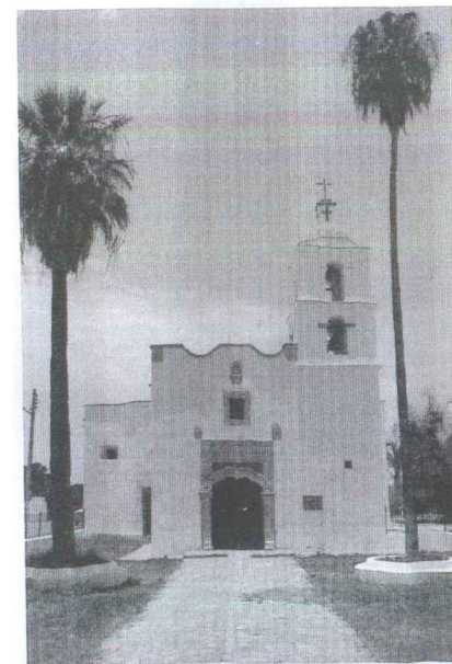
Capilla de la hacienda jesuita de “Los Hornos” 89

Los jesuitas participaron de la economía vitivinícola hispano-tlaxcalteca de Parras, por medio de la producción de sus propios vinos y aguardientes, por los censos y capellanías que los vitivinicultores establecían en su favor, o bien, por las rentas de su hacienda de Hornos. Al parecer, los jesuitas aportaron —hacia 1659— la