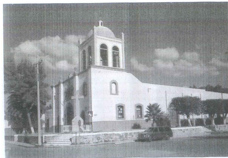
El Colegio de la Compañía de Jesús en Parras

“y los cincuenta para un maestro que les enseñe a leer, escribir y contar” 49