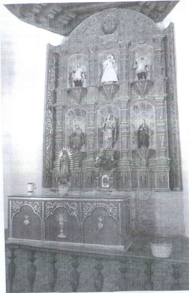
Altar de la capilla. Retablo ornamentado con estípites y santos jesuitas 91

tecnología de la destilación de los orujos como una innovación para Parras. 90 Resumiendo, diremos que en el caso de Parras el grueso de la economía estaba en manos de los terratenientes cosecheros y/o ganaderos, como eran los Urdiñola, los dueños de San Lorenzo, los jesuitas, así como en las manos del pueblo tlaxcalteca y de los vecinos españoles.