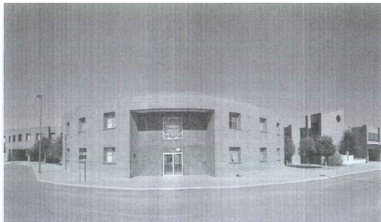
La Escuela Carlos Pereyra en la actualidad